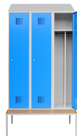
DDDE0850 + option banc DDDE0601 + option coiffe