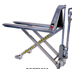
DDZZ0090 : Transpalette haute levée manuel