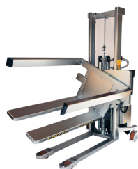
DDZZ0088 : Gerbeur rotateur

Autres modèles de matériel inox. Consultez votre partenaire D-DIRECT.