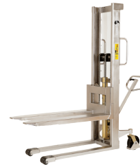
DDEA0779 : Gerbeur manuel inox 1000 kg