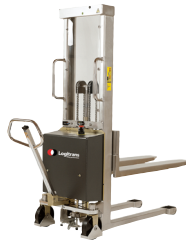
DDAD0776 : Gerbeur semi-électrique